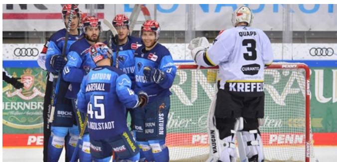
Zwei Heimsiege gegen Krefeld und Berlin konnten die Panther zum Auftakt gegen den Norden feiern.