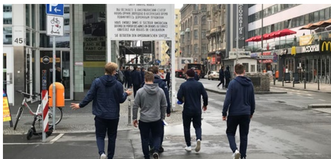
Statt eines Pre-Game Skates gab es am Freitag einen Morning-Walk. Dabei kamen die Panther auch am Checkpoint Charlie vorbei.