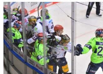
Im Duell mit den Eisbären schenkten sich beide Teams nichts. Ex-Berliner Louis-Marc Aubry schnürte einen Doppelplack.