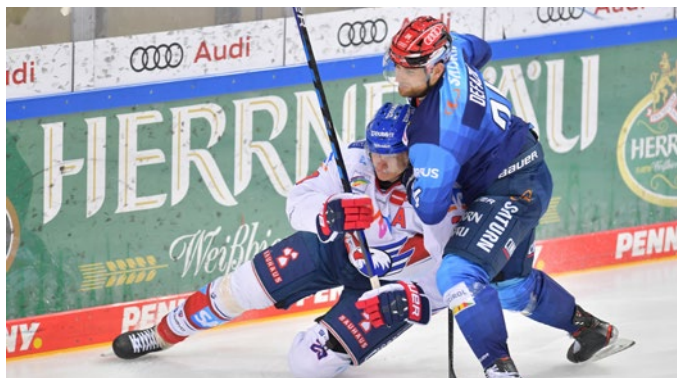
Packende Duelle in der PENNY DEL: Die TV-Übertragungen bei MagentaSport erzielen hohe Zuschauerquoten.

Spiele der DEL im Schnitt mit über 50.000 Zuschauern