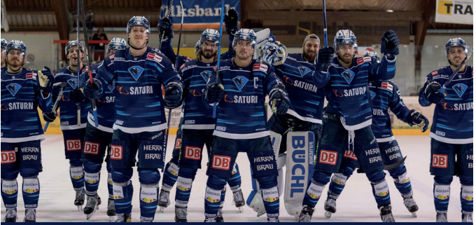
Die Panther konnten beide Vorbereitungsspiele in Latsch/Südtirol gewinnen und feierten mit den Fans.